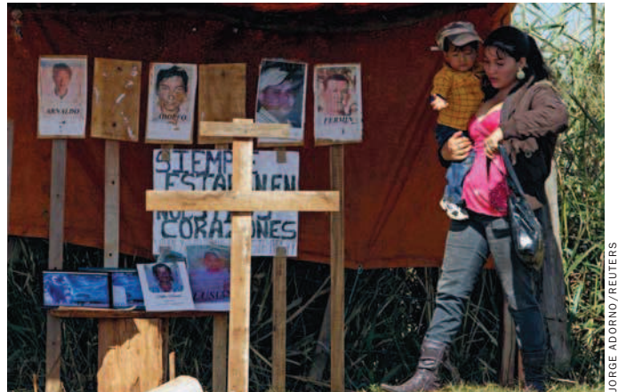
CANINDEYU Herdenkingsplek voor de boeren die omkwamen tijdens de ontruimingsactie op 15 juni 2012.

▶ van voormalig dictator Alfredo Stroessner en de Liberale partij, beschuldigden hem van partijdigheid en incompetentie. Ze kregen zonder enig probleem de vereiste tweederdemeerderheid achter zich om hem af te zetten.