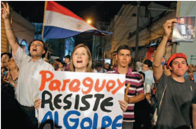
Betoging tegen de 'staatsgreep' in Asunción.