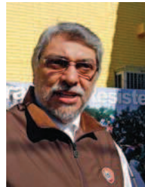
FERNANDO LUGO Zijn kiezers raakten al snel teleurgesteld.

Op 21 april 2013 staan nieuwe presidentsverkiezingen gepland. Veel mensen weten niet of ze gaan stemmen en op wie. De Colorado-partij van de oude dictator zal wel weer aan de macht komen,